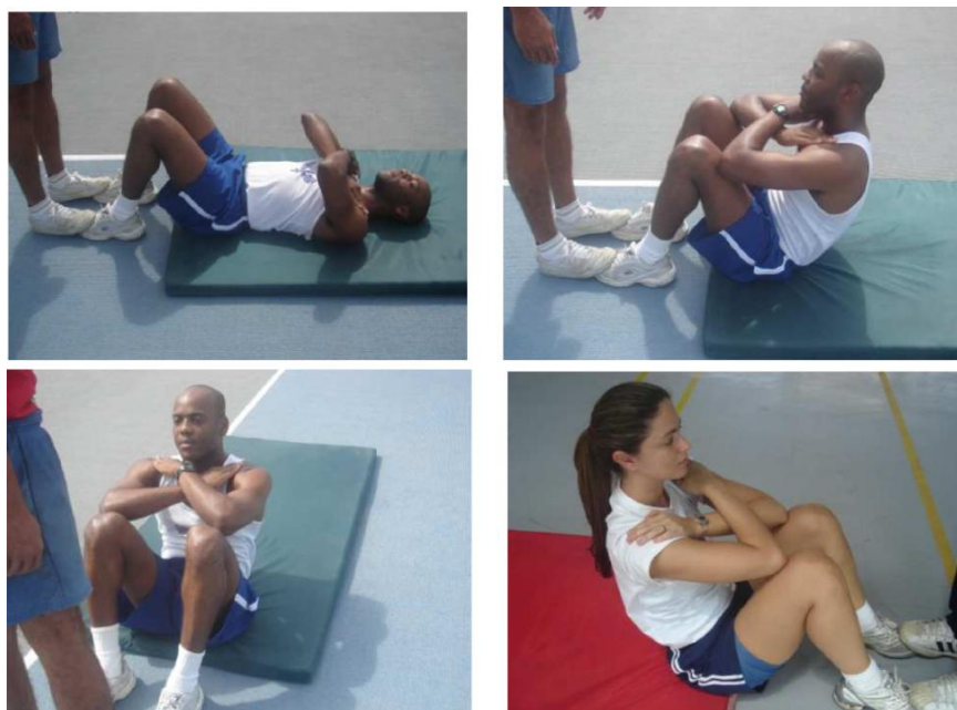
Figura 3 – Flexão de tronco sobre as coxas para os sexos masculinos e femininos. Neste exercício serão exigidos os mesmos padrões de execução para ambos os sexos.

Será avaliada através da flexão do tronco sobre as coxas.